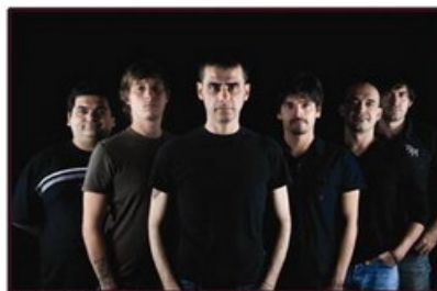
NERI PER CASO